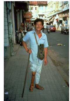
Billede: Mand med svind af muskel og lammelse i ben og fod efter polio

Vaccination imod polio blev indført i 1955 i form af en inaktiveret poliovaccine. I 1961 blev den inaktiverede vaccine suppleret med en levende svækket vaccine (OPV), også kendt som poliosukker, fordi vaccinen blev dryppet på en sukkerknald. Den levende, svækkede vaccine blev udfaset af vaccinationsprogrammet i 2001-2003.